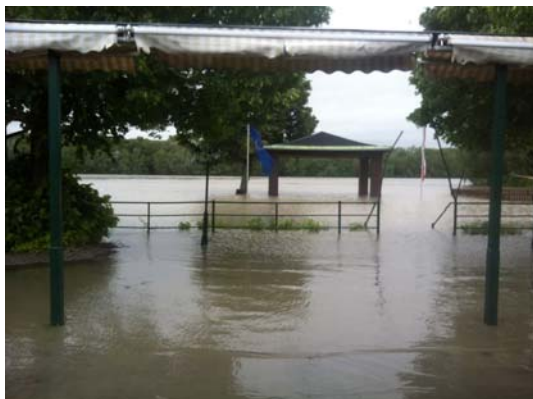
Terrasse des Donaurestaurants, Stand: 3.6.2013

Alle Veranstaltungen finden bei freiem Eintritt und auch bei Schlechtwetter statt (im Donaurestaurant – mit Dach), ausgenommen sind Veranstaltungen mit angegebenen Ersatzterminen.